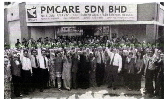
PMCare yang beroperasi di Jalan USJ 21/10, Subang Jaya kini mempunyai kira-kira 270 orang kakitangan tetap.